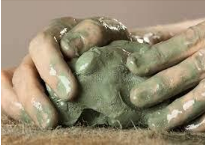
Jesaja 64 vers 7